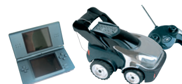
JOUETS / LOISIRS