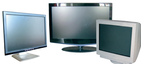
TÉLÉVISEURS / MONITEURS