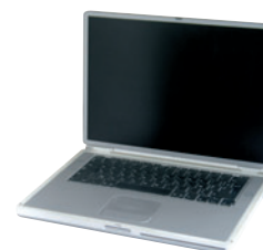
ORDINATEURS PORTABLES / ÉCRANS