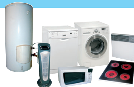
LAVAGE / CUISSON / CHAUFFAGE