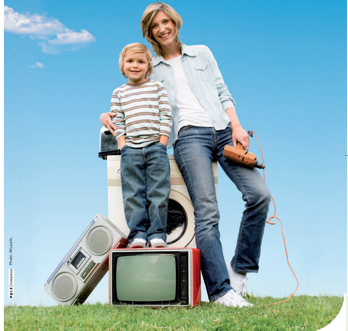
POLE company