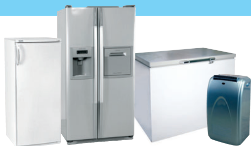
RÉFRIGÉRATEURS / CONGÉLATEURS / CLIMATISEURS