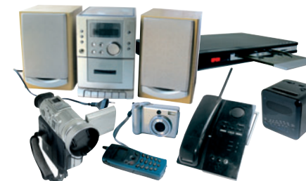
AUDIO / VIDÉO / TÉLÉPHONIE